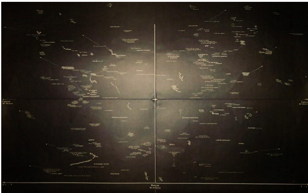
Despliegue del mapa poético Momento de simetría de Arturo Carrera

Si bien no me detendré en esta instancia en el análisis particular del mapa de Carrera, sino apenas en la referencia astronómica recién señalada, la cual me permitirá demostrar mi encuentro con el astro Cardenal. Es importante señalar que los envíos astronómicos diagramados en este artículo también parten esencialmente de los materiales creativos y de las operaciones lingüísticas llevadas a cabo por los poetas. En este sentido, en las constelaciones poéticas que habitan adentro del mapa Momento de simetría es posible detectar un procedimiento de simulación constante entre código poético y código cosmológico, como lo denomina inclusive su autor en la contracara de la lámina, que invita a efectuar con mayor seguridad las conexiones poéticas siguientes. Dicho procedimiento es visible no sólo en el despliegue espacial y disperso de los textos, sino también en la utilización de expresiones propias del discurso astronómico, tales como “polvo de estrellas”, “supernovas”, “enanas blancas”, etc., o en el agrupamiento concentrado de palabras que simulan ser ante los ojos de quien mira acumulaciones estelares y, a la vez, de