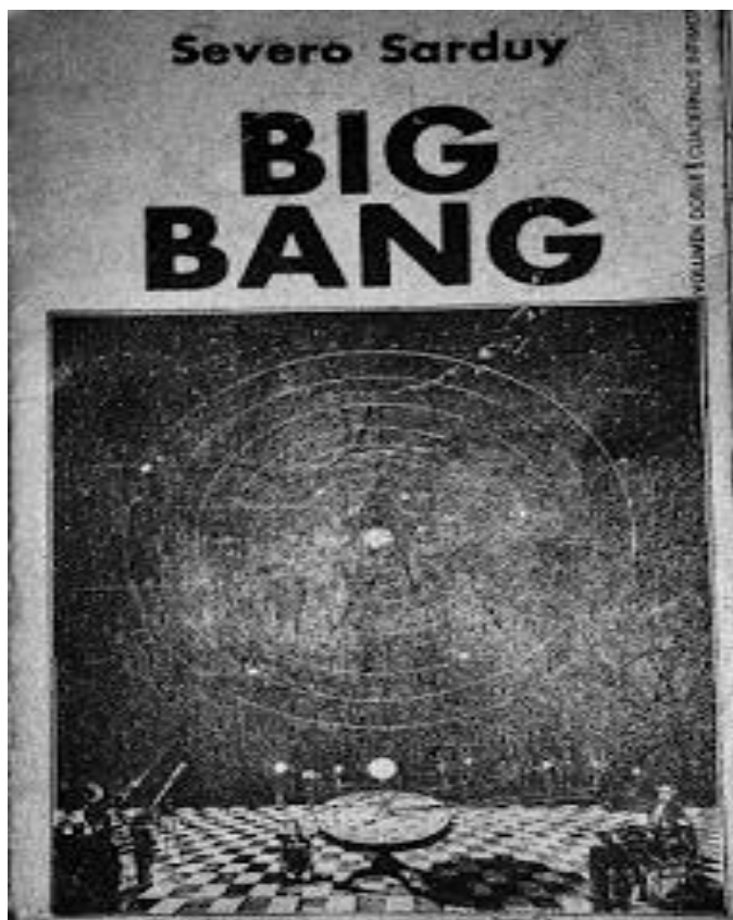
Foto de la tapa de Big Bang editado por el sello Tusquets en 1974. 8

Será el poeta cubano, uno de los referentes más importantes del neobarroco latinoamericano, quien lleve a cabo un amplio estudio en Barroco (1974) sobre las teorías cosmológicas y su impacto en las concepciones modernas del tiempo y del espacio. En este sentido, Sarduy lee con atención dichas teorías y afirma que si bien Copérnico modifica el sistema, por desplazar en su lectura a la tierra del centro del cosmos a la periferia y, de este modo, echar abajo en el siglo XVI el geocentrismo y antropocentrismo (Hauser, 1969: 108, T I), no