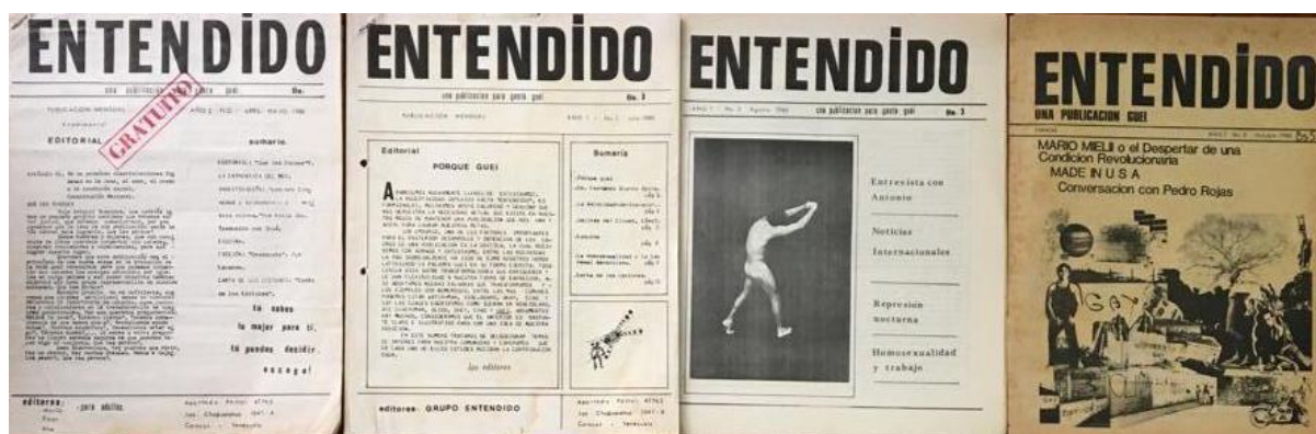
Archivo de la revista Entendido . Archivo Arkhé.

Y luego tenemos por supuesto expresiones bibliográficas. Tenemos la primera revista LGTBI alemana, la primera publicación francesa también. Un grabado de José Guadalupe Posada (el famoso grabadista mexicano que hizo la calavera catrina), de "los 41 maricones", una noticia de 1901. Aquí tenemos la publicación original, que dice "Aquí están los maricones, muy chulos y coquetones".