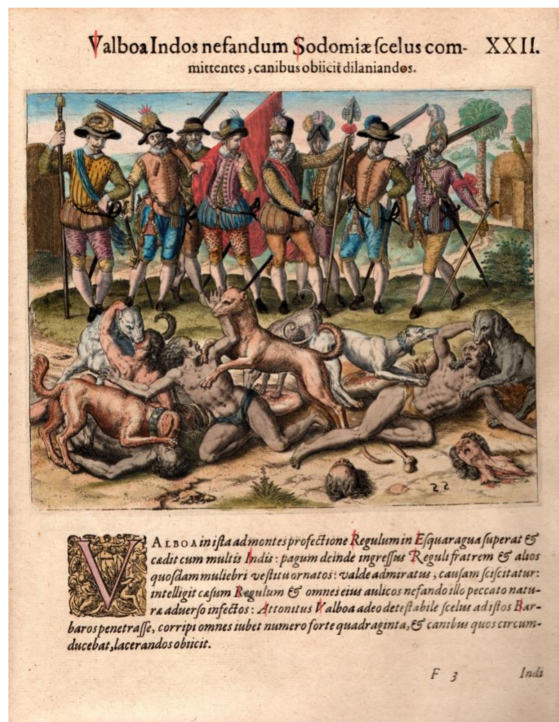
Theodor de Bry, Balboa Indos Nefandum Sodomiae . Grabado coloreado a mano (original), 1594.

Bueno, la pieza más antigua que tenemos en este momento es el libro de Gomorra de San Pedro Damiani, que data del año 1051 pero cuya primera edición es de 1620. Es el primer libro que se conozca en el que la homosexualidad se condena como un problema para la iglesia. Luego, tenemos también un grabado de Theodor de Bry, "Sodomitas aperreados por Vasco Nuñez de Balboa", publicado en Alemania en 1594, que da cuenta de una escena ocurrida en la conquista. En 1513, el conquistador español Vasco Núñez de Balboa llegó a América por Panamá. Al llegar, una tribu local le advirtió de la existencia de un pueblo de "sodomitas". Había, incluso, personas transgénero; se trataba de una tribu en la que las personas podían moverse de manera bastante libre entre los géneros o, mejor dicho, donde el binarismo de género no existía. Los conquistadores decidieron que a esa tribu no había que evangelizarla, ni redimirla, sino que había que exterminarla. E iniciaron una cacería utilizando perros para cazar. La cacería de los sodomitas es un hecho histórico que está escrito en las crónicas de Balboa y que además está retratado gráficamente en este grabado.