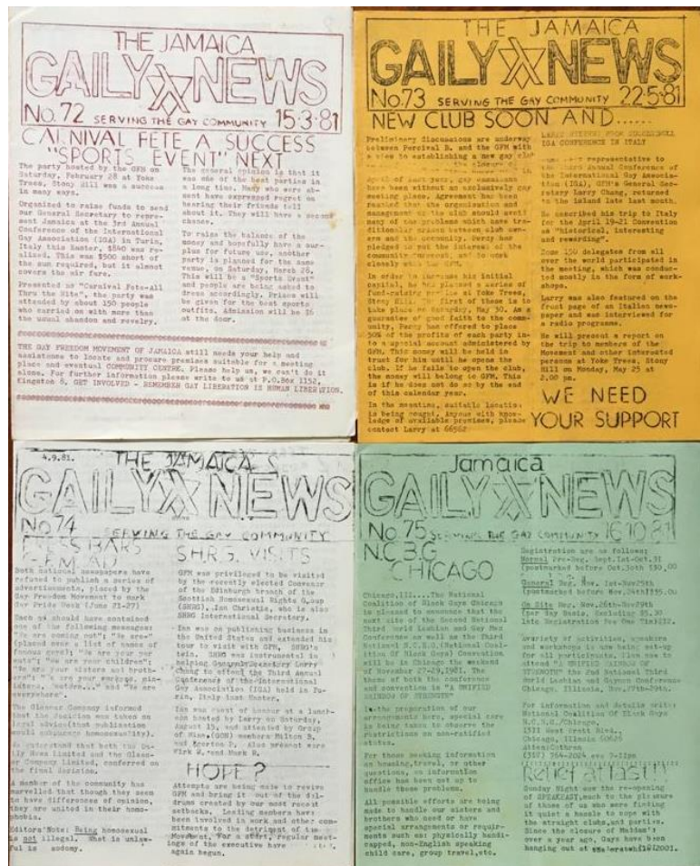
Archivo de la revista The Jamaica's Gaily News . Archivo Arkhéd.

Son materiales valiosísimos para investigadores de todas partes del mundo, pero sobre todo en Latinoamérica. ¿Ustedes cómo se manejan en cuanto al acceso público de estos materiales?