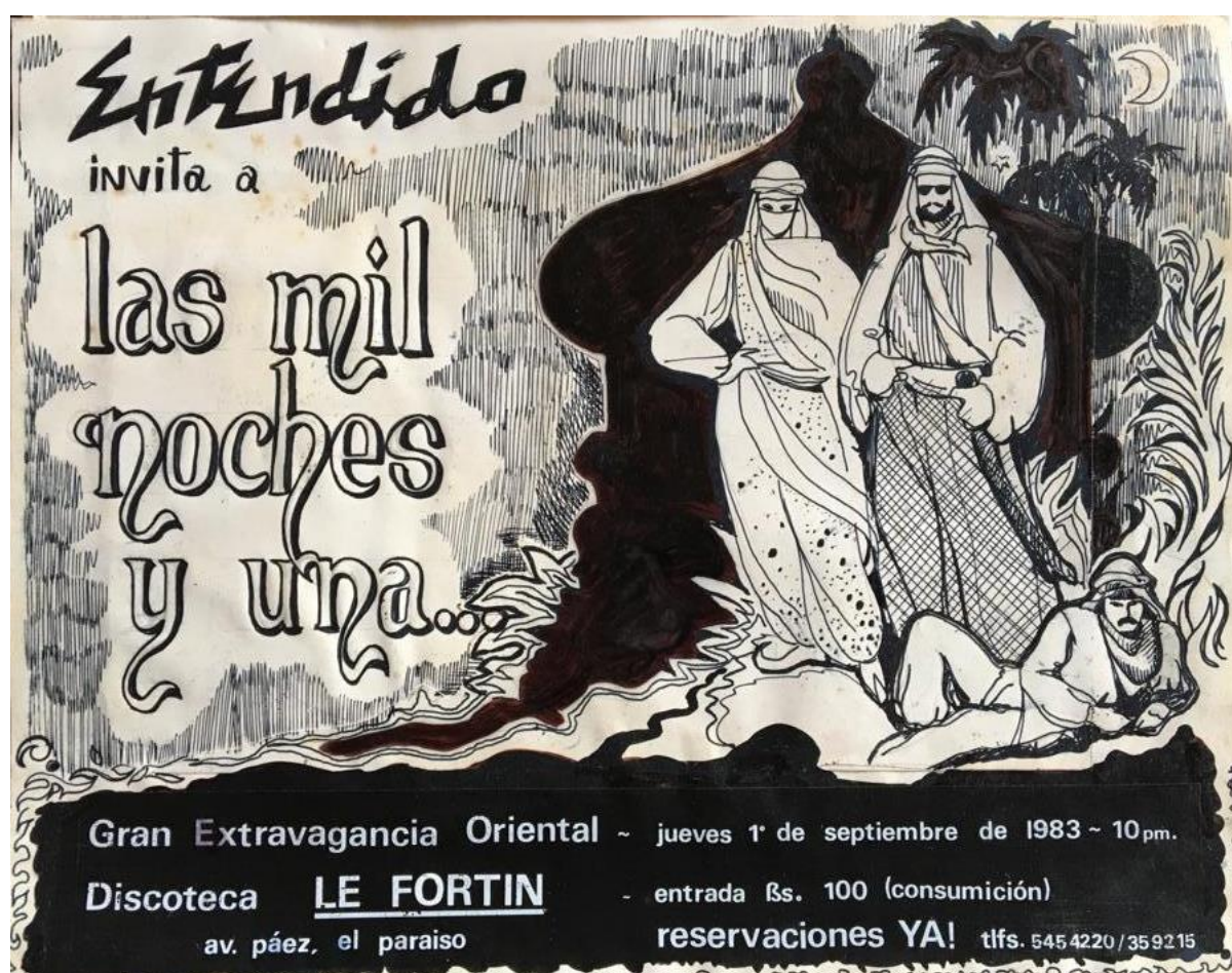
Flyer de invitación a fiesta gay organizada por la revista Entendido .

Ahí viene la otra serie de razones. Sí, estos materiales nacían y se distribuían en la clandestinidad. Entonces, claro, su naturaleza material era precaria. O sea, no eran documentos producidos en buenos papeles y con buenas tintas; los activistas hacían lo que podían con los materiales disponibles y distribuían los documentos en la calle. Y frente a esa preocupación, frente a esa gran ausencia de materiales, empezamos nosotros con el archivo.