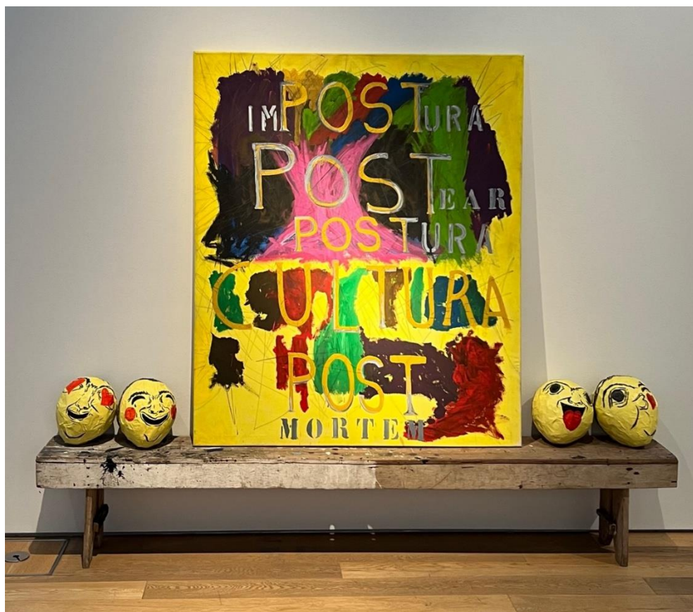
Imágenes 9 y 10. Obras de Juan Martín Solari y Gustavo Marrone.