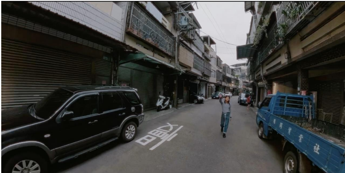
Imagen 11. Fotograma de El auge de lo humano 3.

Este proyecto audiovisual está filmado con una cámara de realidad virtual que registra el espacio circundante como si se tratara de “un ojo absoluto” de 360 grados. Este dispositivo es conformado por un casco que filma la totalidad, en principio sin filtro. Luego, el director, entre una amplísima gama de posibilidades del campo visual recorta aquello de la imagen espacial que le interesa mostrar. A veces, utiliza los registros de más de una cámara deformando la imagen de manera tal que tenemos una vista panorámica y con un ojo de pez se ven paisajes sublimes o directamente un glitch en las imágenes (esos errores digitales, que evidencian el dispositivo, pero sin que eso logre molestar). El tópico de viaje y de torre de babel se fusionan como una exploración de un grupo humano hacia lo desconocido que produce formas poco comunes y visiones alteradas.