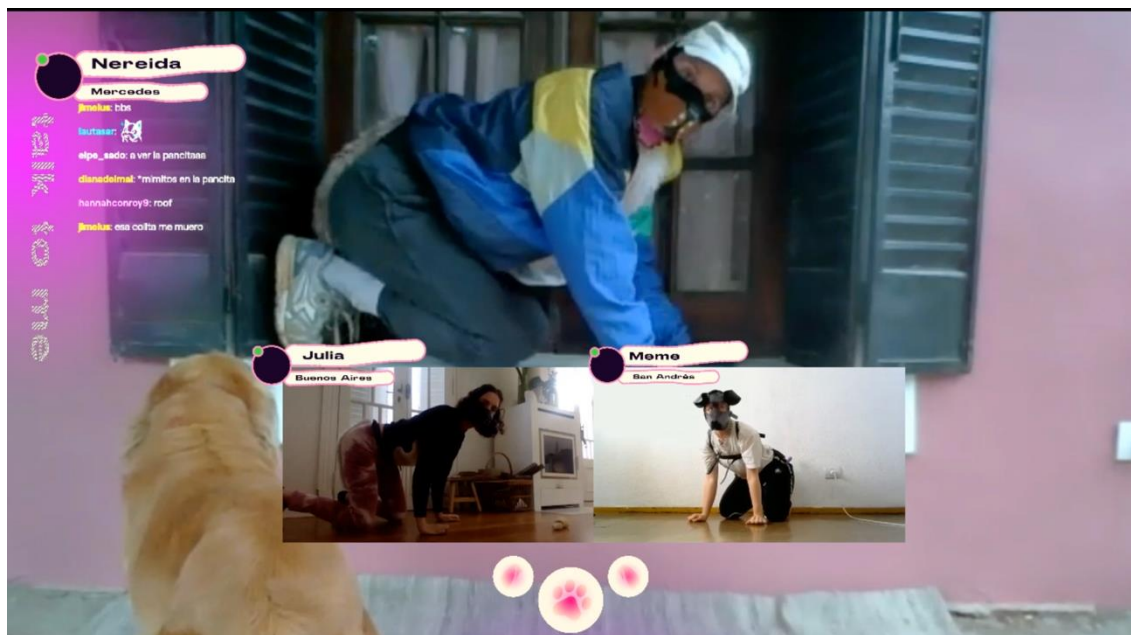
Imágenes 1 y 2. Frames de Puppy calls and accidents ..

En el texto que acompañaba el video explicaban que lo que buscaban era imaginar e intercambiar nuevas miradas en el tránsito por la altura visual de un perro. Estas acciones, para ser vistas en streaming entre las ciudades de Berlín, Mercedes y Buenos Aires, imaginan una videollamada entre cachorros. Desde una interface que se corresponde con la plataforma Twitch, 9 las situaciones múltiples coexisten e intentan acercar al espectador a la experiencia-perro, un devenir perro que resulta un devenir animal. El modo en la que la plataforma Twitch se utiliza disloca su manera tradicional, a la vez que propone una ampliación de la imaginación en cuanto a lo que es posible de ser pensado en relación a lo comunicativo. En vez de ser una comunicación directa, el uso de la plataforma apela al discurso no verbal de una manera cómica y lúdica que se sale del lugar común para el que se suele utilizar. Al protagonizar las llamadas, los animales colocan a la tecnología a su servicio y generan un distanciamiento con los espectadores respecto al uso