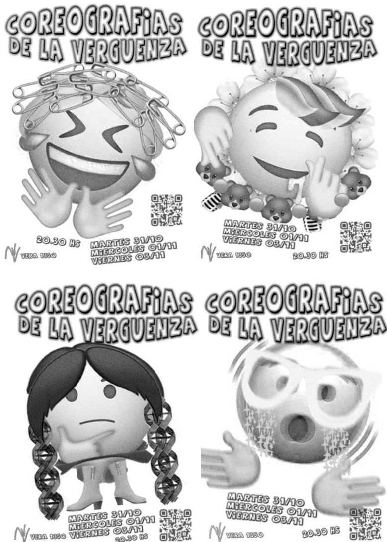
Imágenes 3 a 8. Los seis afiches de Coreografías de la vergüenza que se corresponden con la caracterización de los performers.

Estos emojis que se corresponden con las características del vestuario y la personalidad de los personajes o performers también los desbordan y permiten puntos de fuga en los que cualquiera que pertenezca a una generación nacida entre las décadas de 1980 al 2000 se puede reflejar. Sintetizan de algún modo esas presencias raras como unas afecciones inventadas. Desde una incomodidad con el mundo virtual que en la experiencia cotidiana es una manera de interconexión y adicción. Desde el malestar que causa la imposibilidad de enterarse de lo que pasa afuera, sin estar mediado por los