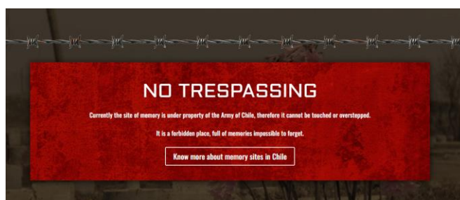
Figura 6. Pepe Rovano. Memorial Rocas . Documental interactivo. Disponible en línea.