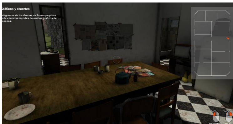
Figura 11. Huella digital. Centros clandestinos. El campito, edificio de mampostería . Documental interactivo. Disponible en línea.