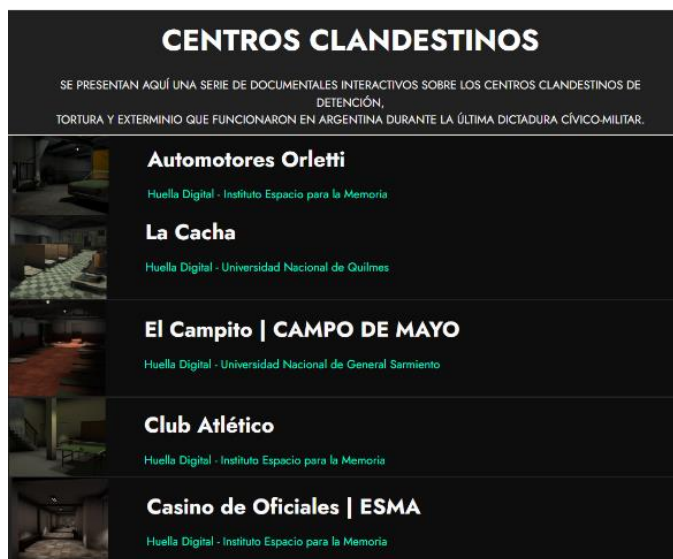
Figura 7. Huella digital. Centros clandestinos . Documental interactivo. Disponible en línea.