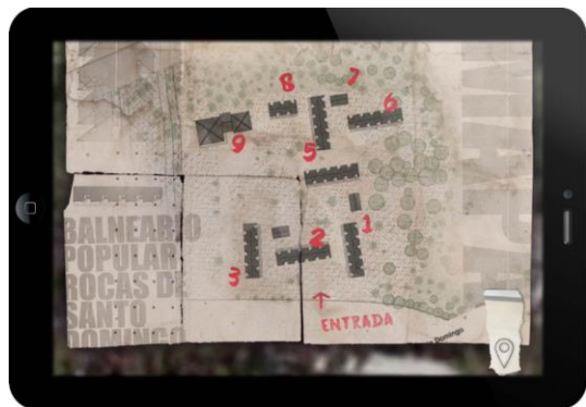
Figura 4. Pepe Rovano. Memorial Rocas . Documental interactivo. Disponible en línea.