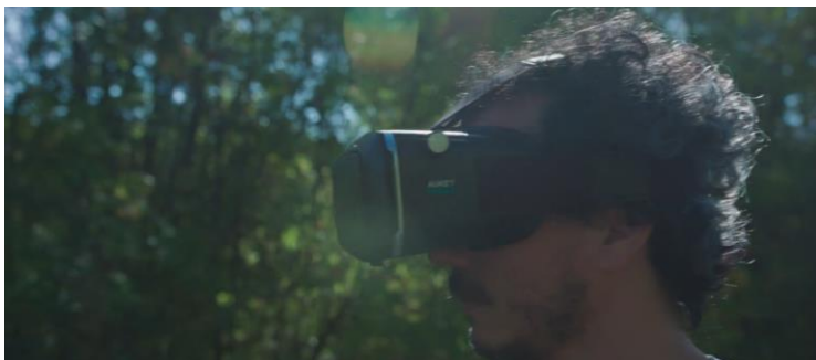
Figura 8. Jonathan Perel. Camuflaje . Película documental, 93 min. Argentina: Off the Grid / Alina Films, 2022.