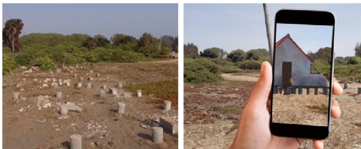
Figura 3. Pepe Rovano. Memorial Rocas . Documental interactivo. Disponible en línea.