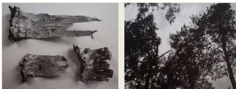
Figura 12. Georges Didi-Huberman. Cortezas . Libro. 2011.