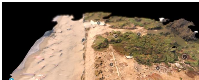
Figura 5. Pepe Rovano. Memorial Rocas . Documental interactivo. Disponible en línea.