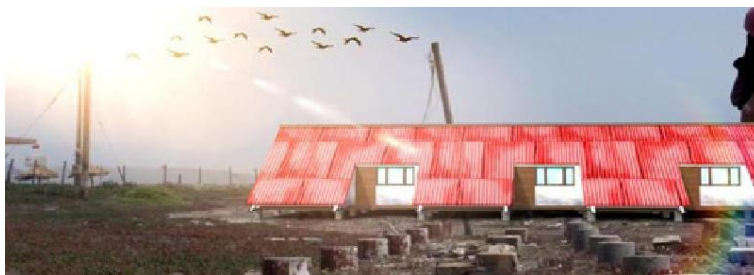
Figura 1. Pepe Rovano. Memorial Rocas . Documental interactivo. Disponible en línea.