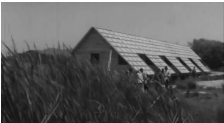
Figura 2. Pepe Rovano. Memorial Rocas . Documental interactivo. Disponible en línea.