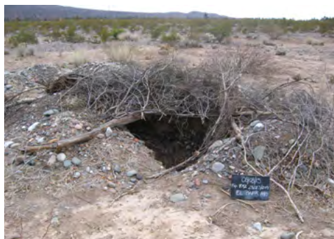
Figuras 8 y 9. Fotos tomadas entre 2014-2018 en sectores del ex CCD Polígono de Tiro en el Campo Gral. Sarmiento y en las adyacencias del Camping El Pinar, localidad de Marquesado, Departamento Rivadavia, San Juan.