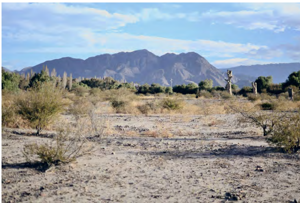
Figura 4. Vista del interior (Sector norte) del ex CCD La Marquesita.

Los escombros de tierra y la basura fueron acumulados en pequeñas montañas al fondo de la finca, producto de la acción de las máquinas retroexcavadoras utilizadas para demoler las precarias estructuras que quedaron en pie como evidencia del exiguo campo clandestino montado en el corazón mismo del ex CCD La Marquesita. 49 Una especie de doble clandestinidad se juega en este macabro emplazamiento de un CCD den-