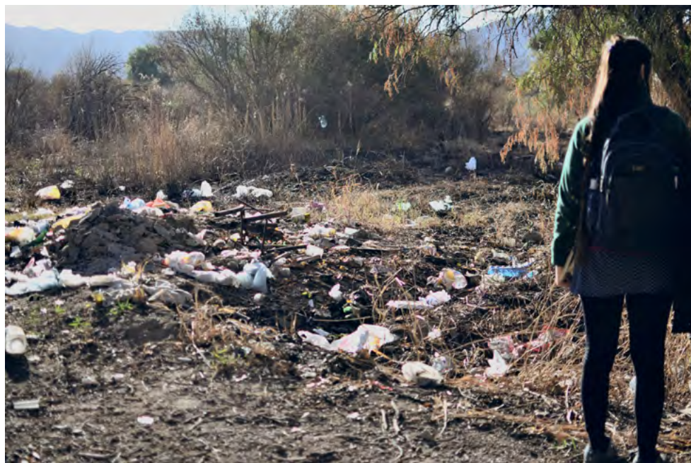
Figura 6. Vista del interior derrumbado (Sector norte) del ex CCD La Marquesita.