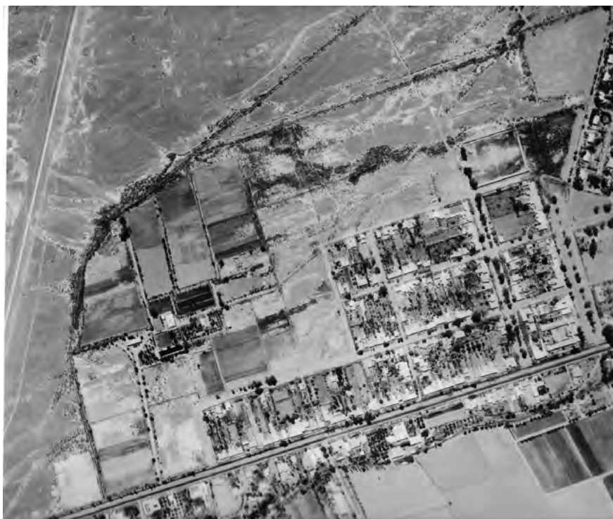
Figura 2. Fotografía aérea de 1973. Vista en planta de la Finca de La Marquesita y zonas contiguas de los barrios de la localidad de Marquesado, Departamento Rivadavia, San Juan. Foto ampliada escala 1:5000.

Esta tesitura pudo ser construida pacientemente a lo largo de cinco años de investigaciones, que incluyeron intensivos trabajos de prospecciones arqueológicas en el ex CCD La Marquesita; el ex CCD del ex Polígono de Tiro del RIM 22 –ubicado