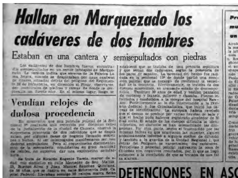
Figura 3. Recorte de diario con la nota periodística, Sección provincial del Diario de Cuyo , sábado 14 de agosto de 1976.