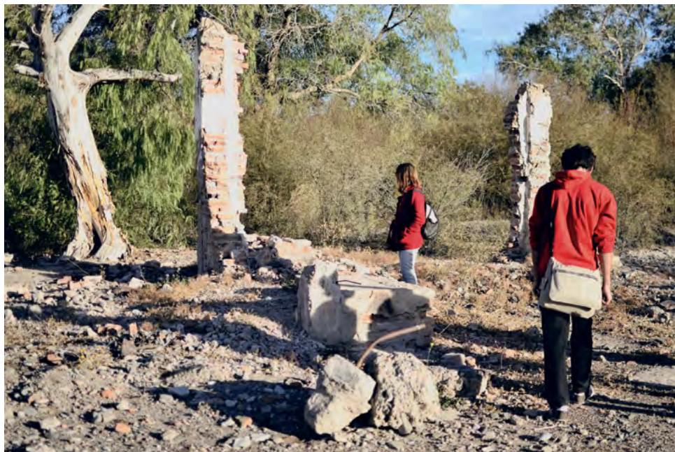
Figura 5. Vista del interior derrumbado (Sector norte) del ex CCD La Marquesita.