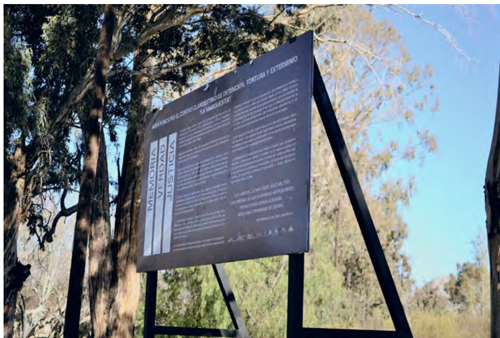
Figura 7. Cartel de Señalización del ex CCD La Marquesita, inaugurado en julio de 2013 e ingresado en la lista de Sitios de la memoria del Refesim. Fotografía tomada en julio 2013, Archivo del Observatorio Ciudadano de Derechos Humanos San Juan.

tro de otro CCD. Su propósito parece haber estado dirigido a ocultar este lugar de la vista de aquellos que entraban por la entrada principal de la finca, ubicada por el sur desde la avenida Gral. Libertador San Martín. Otra jugarreta socarrona de la historia.