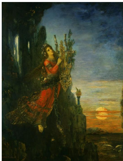
Figura 3. Moreau, Gustave. Safo . Óleo sobre tela 85x67cm, 1893. Col. privada.