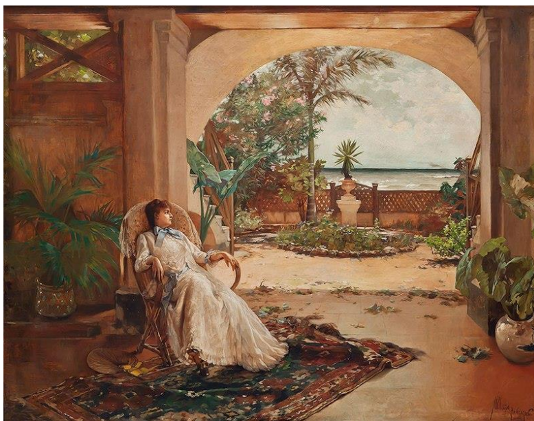
Figura 5. Collazo, Guillermo. La siesta . Óleo sobre tela 66x83.5 cm, 1888. Museo Nacional de Bellas Artes de Cuba.

La presencia de un tipo de paisaje que se construye a partir de contrastes e impresiones fuertes lo desvincula de estilos como el del cubano Guillermo Collazo (Fig. 5). Escribe Casal sobre los paisajes de este artista: "todos se recomiendan por la verdad del tono, la fineza del pincel y un