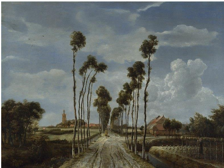
Figura 1. HOBBEEMA, MEINDERT. La avenida de Middelbarnis . Óleo sobre tela 102x140cm, 1689. National Gallery, Londres