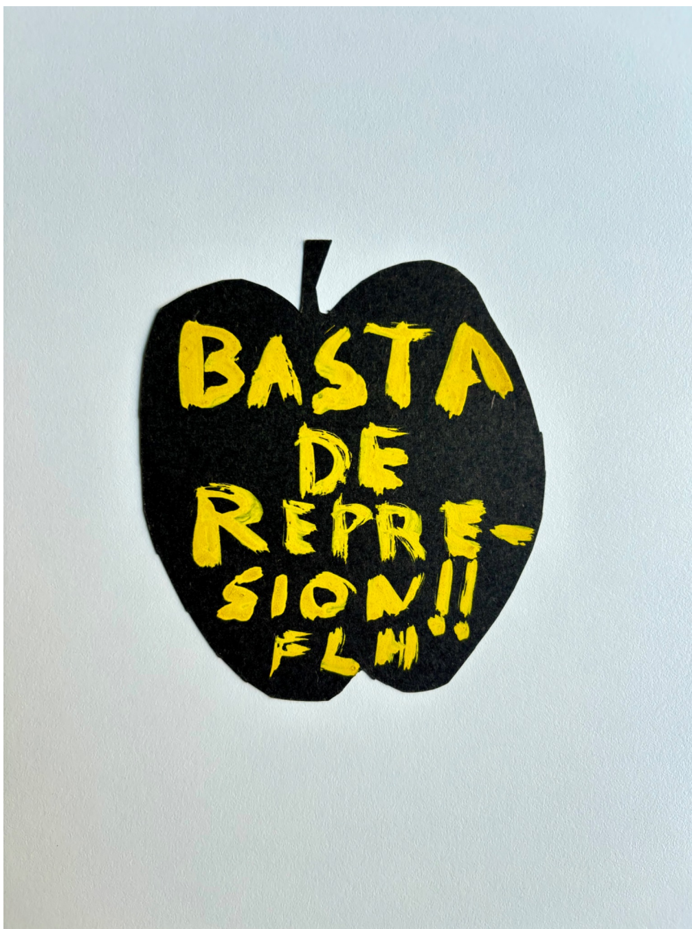
“Basta de represión!! FLH”. Témpera sobre cartulina. Grupo Eros, septiembre de 1973.