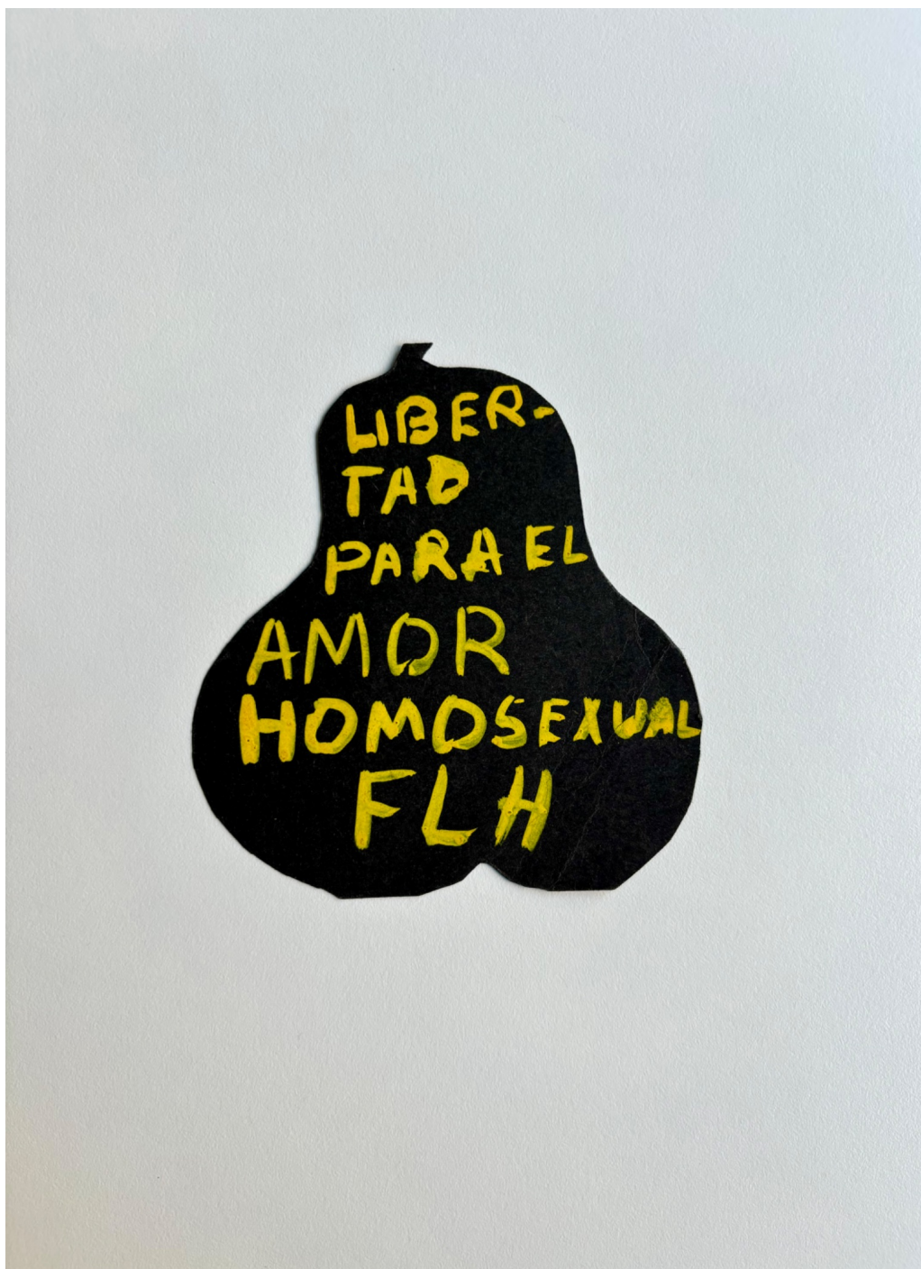
“Libertad para el amor homosexual”. Témpera sobre cartulina. Grupo Eros, septiembre de 1973.