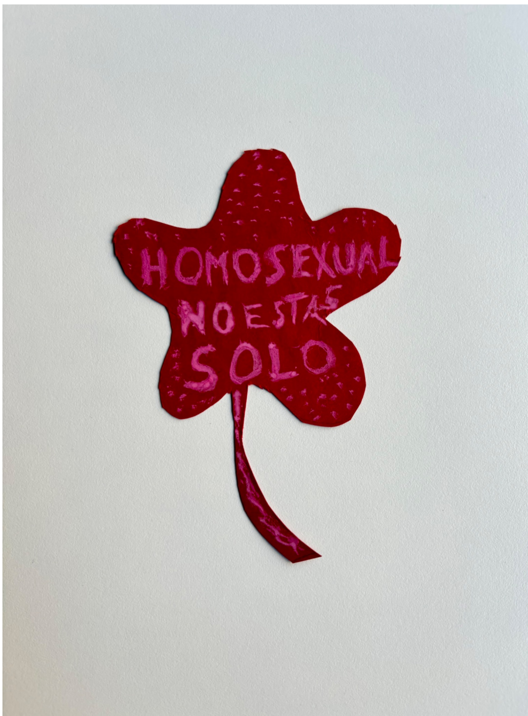
“Homosexual no estás solo”. Témpera sobre cartulina. Grupo Eros, septiembre de 1973.