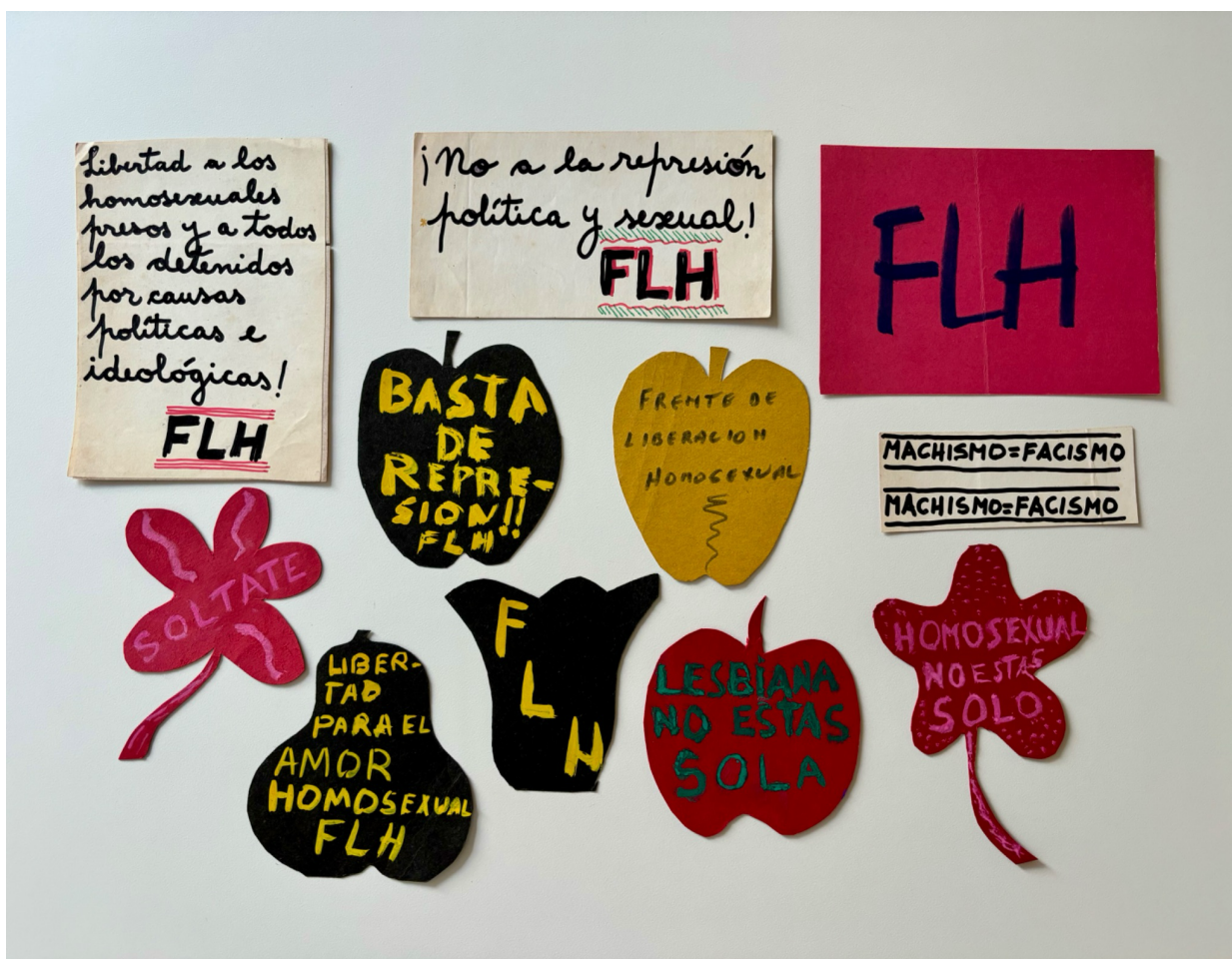
Figuras de flores y frutas realizadas en 1973 por el Frente de Liberación Homosexual para repartir el Día de la Primavera. Las obleas adhesivas con consignas fueron realizadas por Juan Carlos Vidal en 1974.