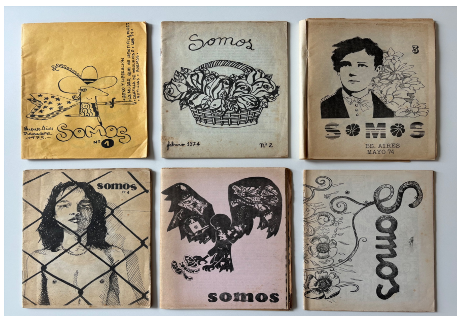
Los primeros seis números del boletín clandestino Somos [1973/1975], del FLH, editado por el Grupo Eros, con la colaboración del resto de los grupos del Frente.

Ernesto también nos aporta datos sobre cómo y dónde el FLH vendía su boletín y de las tensiones que generaba esta publicación puertas adentro: “(...) Después de estas figuritas publicamos Somos e íbamos los domingos a la feria de la Plaza Francia, que era super concurrida, y entre los puestos de artesanos había uno gay conocido nuestro a quien le llevábamos ejemplares para que vendiera, le dejábamos unas 5 ó 6 porque tenía clientela de ambiente. Era el único ahí que se atrevía a vender la revista. Igualmente, en la próxima visita, nos devolvía ejemplares porque no despertaba mucho interés. El tema es que la revista chorreaba ideología y las locas la miraban una vez y la tiraban. Nosotros siempre seguíamos a quienes la compraban para ver la reacción, y las que eran tiradas las juntábamos porque nos costaba mucho hacer la revista. Esa era una de las actividades, no era que arrojábamos volantes al aire y listo, hacíamos disimuladamente un estudio de observación sobre las reacciones y luego las comentábamos en las reuniones. Hubo una fuerte discusión con Perlongher porque le planteábamos, aunque no quisiera entenderlo, que no se podía conformar a todas las locas con una misma publicación, y que a una marica que se maravillaba con una cortinita de organdí no le podías ofrecer una revista para leer a Jean Genet que te hablaba de una pija cagada”. [9]