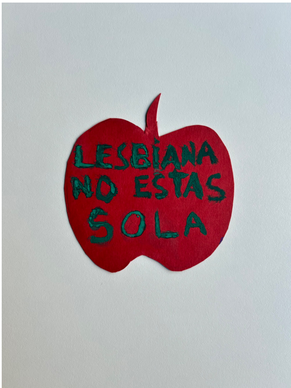
“Lesbiana no estás sola”. Témpera sobre cartulina. Septiembre de 1973.