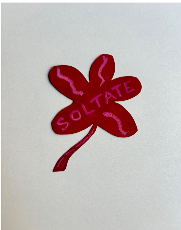
“Soltate”. Témpera sobre cartulina. Grupo Eros, septiembre de 1973.

A principios de septiembre de 1973 el Grupo Eros del FLH acordó llevar adelante una acción para los festejos del Día de la Primavera (en el contexto de la primavera peronista). Por sugerencia de Perlongher, el grupo concurriría ese día a distintas plazas y calles céntricas de Buenos Aires para repartir entre el público consignas de lucha del Frente escritas en figuras con forma de flores y frutas. Entre estas frases estaban “Lesbiana no estás sola”, “Homosexual no estás solo”, “Soltate”, “Libertad para el amor homosexual”, “Basta de Represión”, “Libertad a los homosexuales presos y demás detenidos”, y otras más.