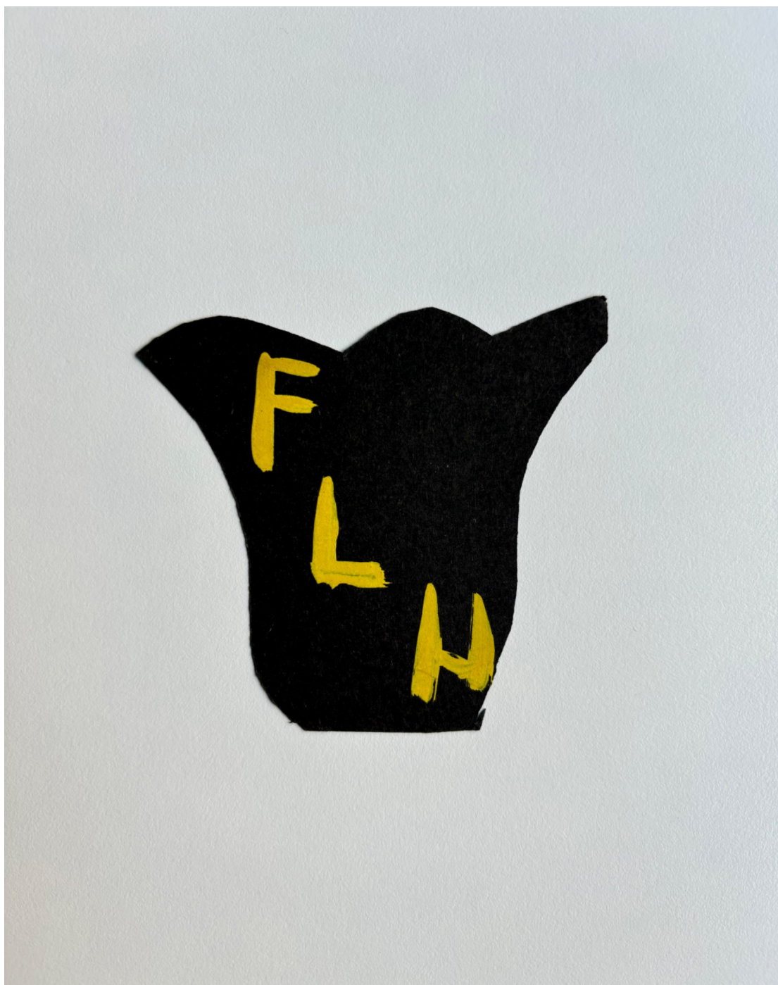
“FLH”. Témpera sobre cartulina. Grupo Eros, septiembre de 1973.