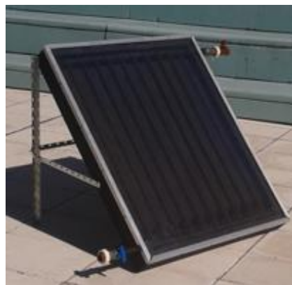
Imagen 1: Prototipo de termotanque solar construido en la UNTREF.

En cuanto a la búsqueda de formas de generación de energía no eléctrica, se decidió trabajar con la tecnología termosolar por su aplicabilidad en dicha zona y la posibilidad de diseñar y construir prototipos de termotanques solares de forma sencilla y con materiales de fácil acceso. Durante los años 2014 y 2015 se desarrolló un prototipo de termotanque solar para construcción comunitaria. La imagen 1 muestra una fotografía del prototipo construido en la UNTREF. [16]