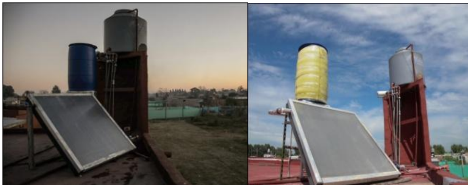
a) Primera configuración del equipo.