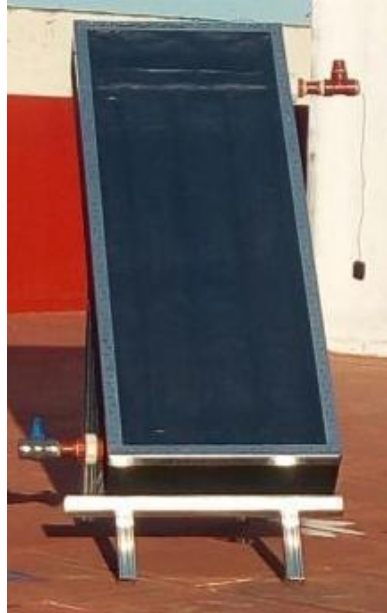
Imagen 4: Prototipo a escala construido en UNTREF durante 2017.

construcción e instalación comunitaria de termotanques solares en 5 hogares de Barrionuevo, Merlo.