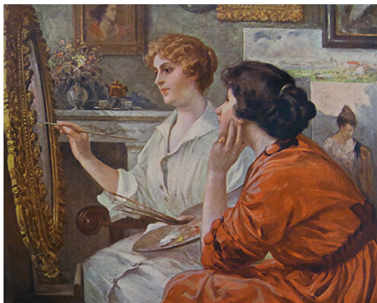
Francesco P. Parisi, Los últimos toques , ubicación actual desconocida.

Sin embargo, no se trató solo de escritos, sino que también las imágenes de la mujer artista se multiplicaron. Francesco Paolo Parisi, quien había establecido una academia íntegramente dedicada a la educación artística femenina a comienzos del siglo XX, pintó un cuadro, cuya ubicación actual es desconocida, sobre el tema.