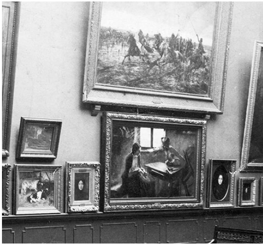
Toros en el Museo Nacional de Bellas Artes, Buenos Aires, ca. 1911.