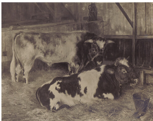
Julia Wernicke, Toros , 1897, óleo sobre tela, 55 x 70,2 cm, Museo Nacional de Bellas Artes, Buenos Aires. Número de inventario: 1644.

La obra estuvo expuesta durante varias décadas entre pinturas que hasta el día de hoy tienen la categoría de “obras maestras” del arte nacional, tales como La vuelta del malón de Ángel Della Valle y Sin pan y sin trabajo de Ernesto de la Cárcova. Este hecho nos reenvía al sitio cambiante que han tenido las mujeres artistas en la consideración cultural. Toros , con su apelación a una nascente iconografía animalista nacional, era una obra adecuada tanto para figurar en las salas del Museo Nacional como para representar a la Argentina en los certámenes internacionales.