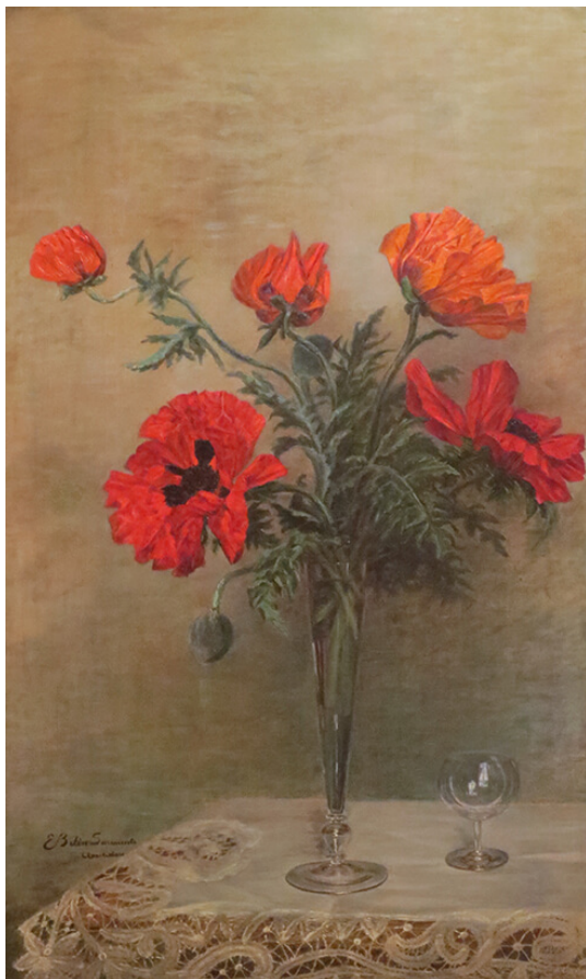
Eugenia Belin Sarmiento, Amapolas rojas , óleo sobre tela, 99 x 60 cm, Museo Histórico Sarmiento, Buenos Aires. Número de inventario: 1077.

La relevancia de las mujeres artistas en el imaginario finisecular también tuvo su impacto sobre Schiaffino. Así lo demuestran tanto el envío realizado a la Louisiana Purchase Exposition (Saint Louis, 1904) como la adquisición, para el Museo Nacional de Bellas Artes, de la obra Toros de la propia Wernicke.