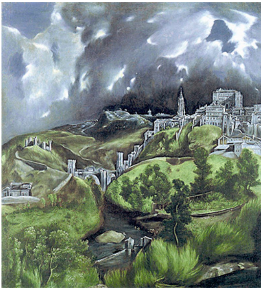
El Greco, Vista de Toledo , c. 1597