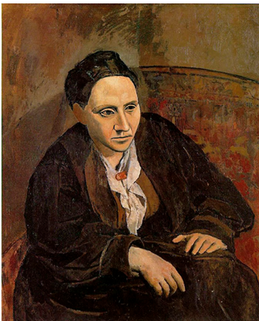
Pablo Picasso, Retrato de Gertrude Stein, 1906, (detalle)

Si lo que, en un principio, buscaba Gertrude Stein al instalarse en París era el amparo del anonimato para sentirse libre, esa libertad, expresada claramente en el coleccionismo de arte, desembocaría en todo lo contrario: visibilidad. Porque, aunque es cierto que en el París de principios del siglo XX, había muchos otros salones auspiciados por damas tan cultas como poco convencionales, que siguiendo la tradición ilustrada pretendían crear un ambiente propicio para la