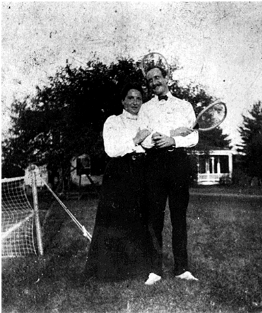
Gertrude y Leo Stein durante sus años estudiantiles, Cambridge, c. 1897