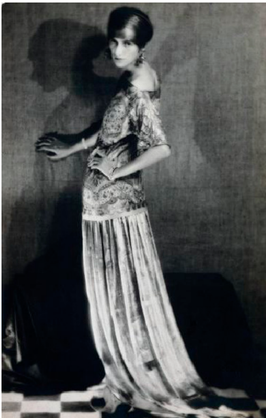
Peggy Guggenheim (1898-1979), fotografía de Man Ray, c. 1924

Entre otros méritos, todas ellas –respectivamente Louise Havemeyer, Gertrude Stein, Peggy Guggenheim y Dominique de Menil– poseían características comunes, como una determinación y una capacidad de iniciativa que les permitió prescindir de las convenciones de su entorno. Todas ellas supieron reinventarse, definir una imagen propia, sin dejar que ese proceso dependiera de lo que otros decidiesen por ellas. Ellas escogieron cómo querían definirse, quiénes querían ser y qué lugar querían ocupar en el mundo. Y en todos los casos, el coleccionismo de arte fue un factor importante.