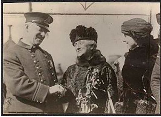
Luisine Elder Havemer y Vida Milholland saludadas por el alcalde a su entrada en la cárcel de Syracuse, 1919

La audacia de Louisine, tanto en el terreno de sus gustos artísticos como en el de sus posiciones políticas, la singularizaba en el contexto de la alta sociedad neoyorquina a la que, por su situación económica, pertenecía. Una generación más tarde, otra mujer procedente de esos círculos pero deseosa de desembarazarse de sus encadenantes preceptos se trasladó a París, la ciudad donde Louisine Havemeyer había viajado tantas veces a realizar sus expediciones coleccionistas. Era ya 1920, y aquella mujer era Peggy Guggenheim (1898-1979). A diferencia de Louisine, Peggy llegó para quedarse y formar parte de su ambiente artístico más bohemio, inicialmente, de la mano de un artista oscuro en todos los sentidos, Laurence Vail, con quien llegaría a casarse y liberarse más tarde también de él. Después de una infancia nublada por la pérdida de su padre adorado víctima en el naufragio del Titanic, acabó por encontrar en el inexplorado mundo del arte de vanguardia, es decir, del imprevisible arte del presente, precisamente, una puerta de salida de todo lo previsible. No era una locura juvenil: no comenzó a coleccionarlo hasta que tuvo una cierta edad. Pero sí respondió a la necesidad de marcar un territorio propio y diferenciado como suelen sentir los jóvenes, para diferenciarse de su familia y de su entorno.