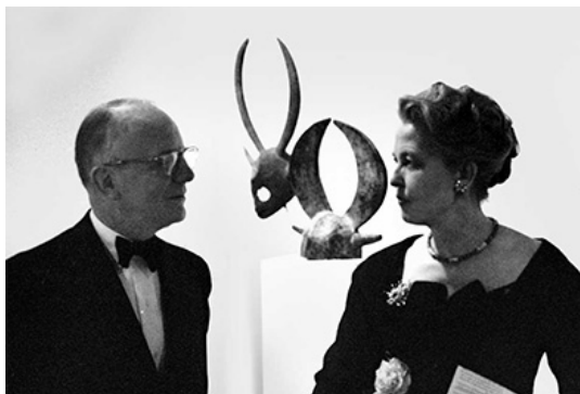
John y Dominique de Menil en la inauguración de la J. and D. de Menil Collection en Museo de Arte Primitivo, Nueva York, 1962