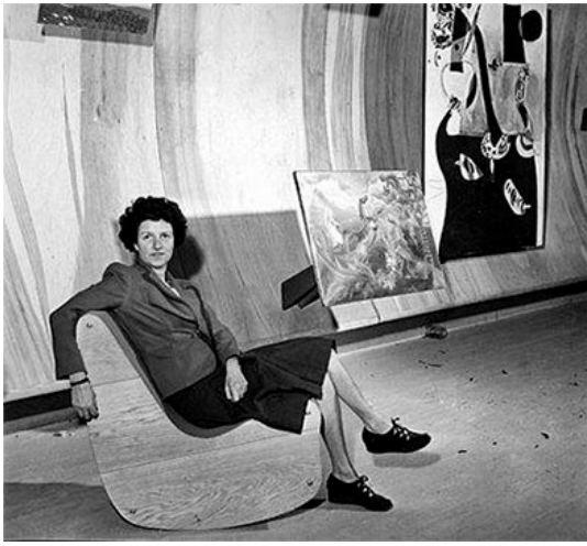
Peggy Guggenheim en la galería Art of this Century, Nueva York, 1942