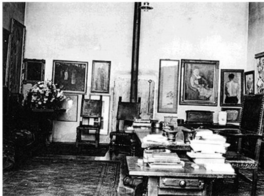
Apartamento de Gertrude y Leo Stein en 27 rue de Fleurus, París

conversación intelectual en un ambiente informal, ha sido el salón de los Stein que se celebraba los sábados en el apartamento del número 27 de la Rue Fleurus, el que ha resultado más mitificado por el relato canónico de las vanguardias. Se ha afirmado en repetidas ocasiones que aquellas recepciones, celebradas regularmente al menos entre 1905 y 1913, sirvieron de foro de debate y de catalizador de muchas de las ideas más innovadoras del arte de su tiempo, desde el fauvismo hasta el cubismo, y que las paredes de ese salón formaron uno de los primeros museos de arte moderno conocidos. Allí se reunían pintores americanos y europeos de vanguardia, desde Henry Matisse, Georges Braque, André Derain, Pablo Picasso, Marie Laurencin, Patrick Henri Bruce hasta Alfred Maurer; coleccionistas de paso por la ciudad como el ruso Shchukin, o el Doctor Barnes de Filadelfia; escritores como Ezra Pound, Djuna Barnes, F. Scott Fitzgerald, Ernest Hemingway o Thornton Wilder; y poetas y críticos de arte como Guillaume Apollinaire, e incluso connoisseurs de corte más clásico, como Bernard Berenson.