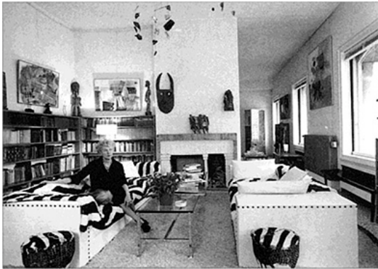
Peggy Guggenheim en la sala de estar del palazzo, hoy Museo Peggy Guggenheim