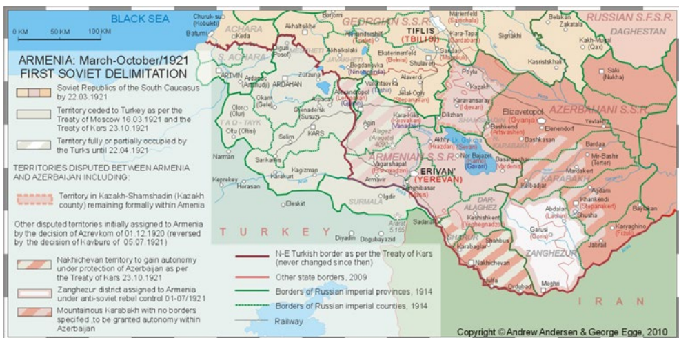
Figura 5. Transcaucasia hacia 1921.

Aún así, en Kars y Alexandropol, los çetes violaron y secuestraron a miles de niñas y mujeres, y saquearon y sometieron a los armenios a un genocidio por desgaste. Como consecuencia, 60.000 armenios murieron en Alexandropol y 18.000 hombres fueron tomados como prisioneros, de los cuales solo 2.000 sobrevivieron, 95 pues fueron enviados a una prisión en Erzurum, donde tuvieron que trabajar casi desnudos en invierno, según un rehén británico de los kemalistas. 96 Es que el gobierno de Ankara le había enviado un telegrama el 8 de noviembre al general Karabekir, ordenándole que “es esencial eliminar a Armenia política y materialmente” (“ ermenistani siyaseten ve maddeten ortadan kaldirmak elzemdir ”). 97 Para esto, debía engañar a los armenios con promesas de paz, para