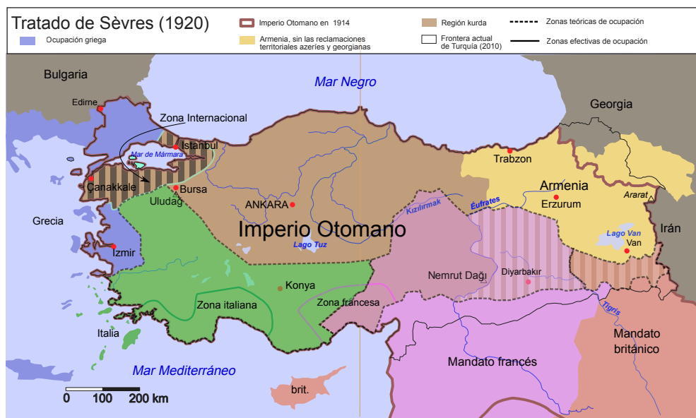
Figura 4. El Imperio hacia 1920.