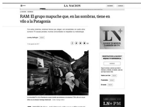
Capturas de pantalla de Clarín y La Nación .