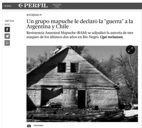
Capturas de pantalla de Diario Perfil .

de Justicia y Derechos Humanos admitió que la conformación del Comando Unificado y la caracterización de la RAM como grupo extremista fue “una declaración política”, sin respaldo de investigaciones judiciales (Portal de noticias En estos días . 9/4/2018).